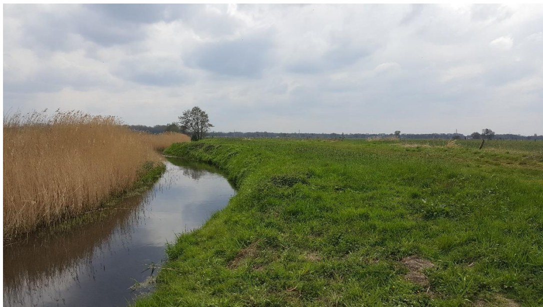
Figuur 4: Foto locatie tijdens veldbezoek op 17 april 2019 (bovenstroomse zijde).