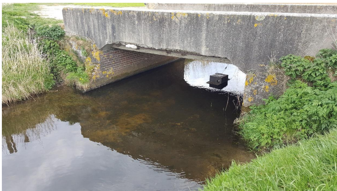
Figuur 3: Foto locatie tijdens veldbezoek op 17 april 2019.