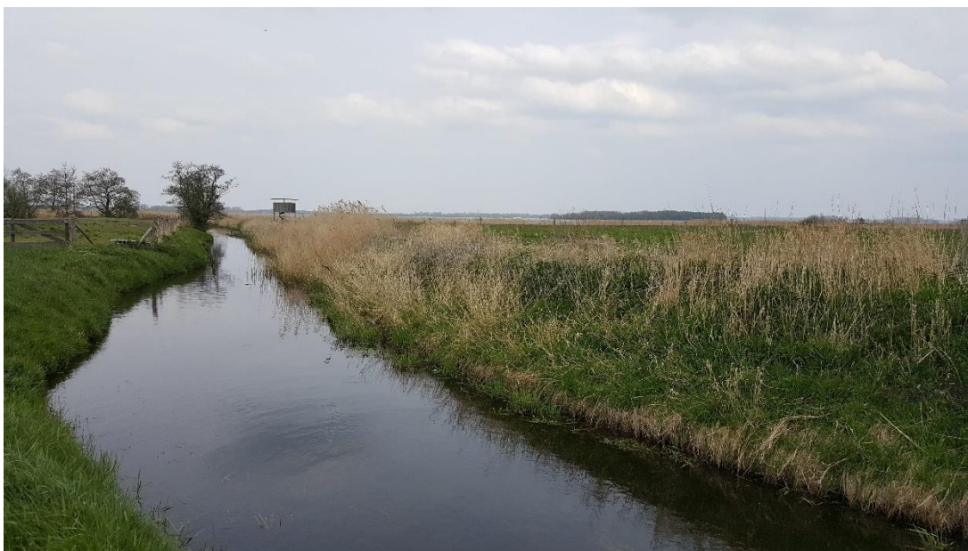
Figuur 5: Foto locatie tijdens veldbezoek op 17 april 2019 (benedenstroomse zijde).