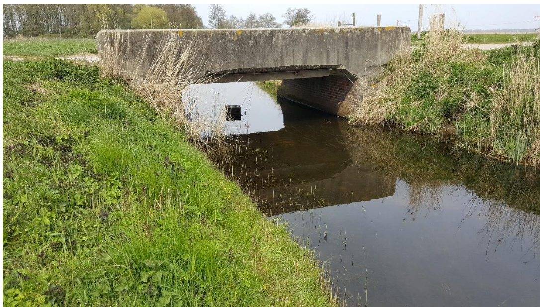
Figuur 2: Foto locatie tijdens veldbezoek op 17 april 2019 (bovenstroomse zijde).